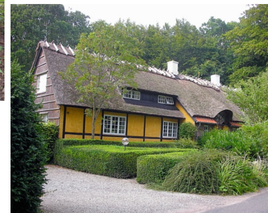
Idyl i skoven

Kør videre ad Fjellebrovej. Lige efter Tingsted Å, ligger ved en skovvej lidt in-