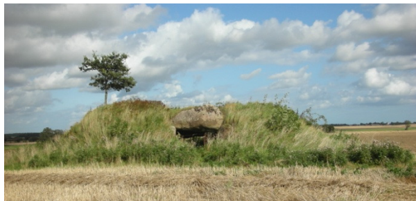
Jættestuen ved Troldemosevej

Kør ad Hannenovvej, Gavlhusvej og Listrupvej. Lidt inde ad Troldemosevejen fører en sti op til Jættestuen, som er fra Bondestenalderen. Kammeret på 13 meter er det længste kammer i Danmark. Ved en udgravning i 1845 fandtes der 30 skeletter