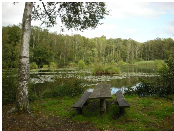
Det idylliske søområde

Der er et system af stier, så man kan gå rundt om søerne og betragte det rige fugleliv. Gå ikke udenfor stierne da der kan være blød bund.