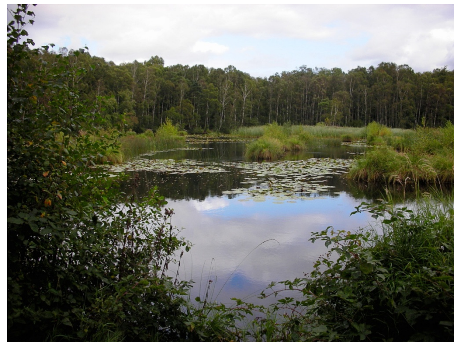
Fra det idylliske søområde ved Borremosen