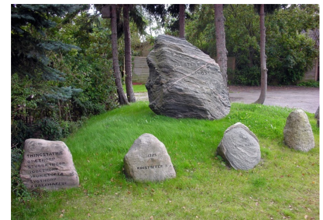
Anlæg ved Tingbanken/Hullebækvej

Overfor kirken er der et lille anlæg, som vidner om, at der her har være afholdt ting. I 1329 sluttedes der her fred mellem Christoffer den 2. og Grev Johan.