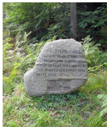
Mindestenen for "Falsters Virke"

i kammeret. Desuden er der fundet ravperler, flintøkser og andet. I 1987 er dyssen restaureret af Skov- og Naturstyrelsen. Kør videre ad Listrupvej og til venstre ad Virketvej. Efter knapt en kilometer ses, før Tresnippen, til venstre mindestenen, der markerer det voldsystem, som i en halvkreds mellem mose- og søområde har dannet en folkeborg, hvor falstringerne i 1158 har søgt ly for Vendernes hærgen. Ved Virket Sø, hvor der er spor efter en borgplads, lå "Trygge Slot". Voldene, som ligger dels enkelte og dels to eller tre parallelt, er fredede.