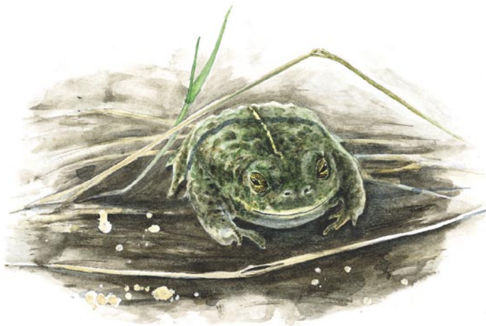
Strandtude. Kendes på den gule rygstribe. Tegning Jens Overgaard

fod, Strandkarse og Strandkål. Hvor jorden er mest sandet på øen, er der begyndt at indvandre overdrevs arter som Almindelig Kongepen, Håret Høgeurt, Hare-kløver og Rank Evighedsblomst. Desuden vokser de relativt sjældne Liden-, Ager- og Kugle-Museurt mange steder på de sandede jorde. I flere af læhegnene finder man blomstrende arter som Syren, Hvidtjørn, Mirabel og forskellige roser.