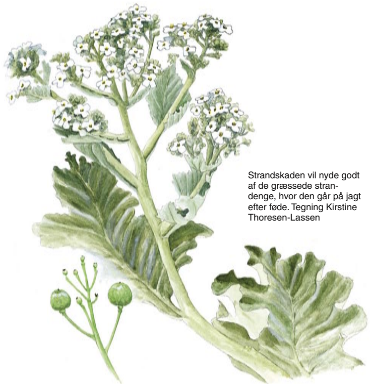
Strandskaden vil nyde godt af de græssede strandenge, hvor den går på jagt efter føde. Tegning Kirstine Thoresen-Lassen