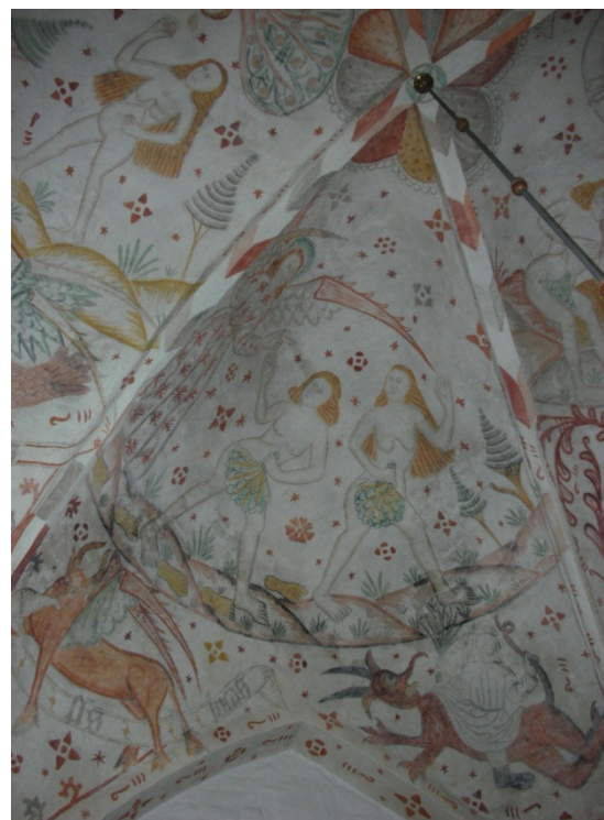
Kalkmalerier i Åstrup Kirke

På Nykøbingvej 54 ligger Stubbekøbing Motorcykel- og Radiomuseum med mere end 150 fantastiske motorcykler tilbage fra 1897 og en række spændende apparater, der viser udviklingen af radio, grammofon og fjernsyn fra år 1900 til i dag.