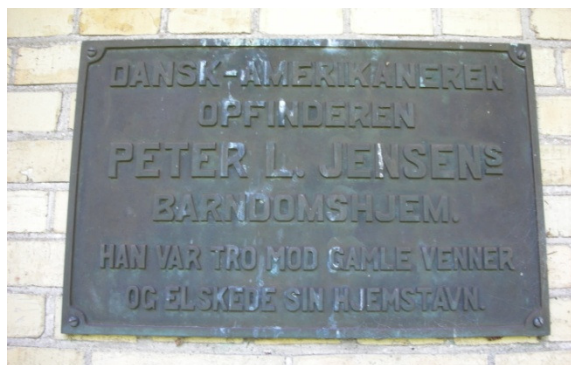
Mindepladen for Peter L. Jensen

Fra Hesnæsvej går ruten ind ad en skovvej, hvor man lidt fremme kører til højre ad Batterivej. Helt ude ved Østersøen ligger en skanse, som blev anlagt omkring 1807 under Englandskrigene. På huset ved Skansen, er der ud mod Østersøen anbragt en mindeplade, som fortæller, at her fødtes Peter L. Jensen. Huset er bygget som lodshus, og Peter L. Jensen var søn af den lods, som dengang beboede huset. Efter endt skolegang arbejdede han hos Valdemar Poulsen i København og tog derefter til Amerika, hvor han opfandt højtaleren.