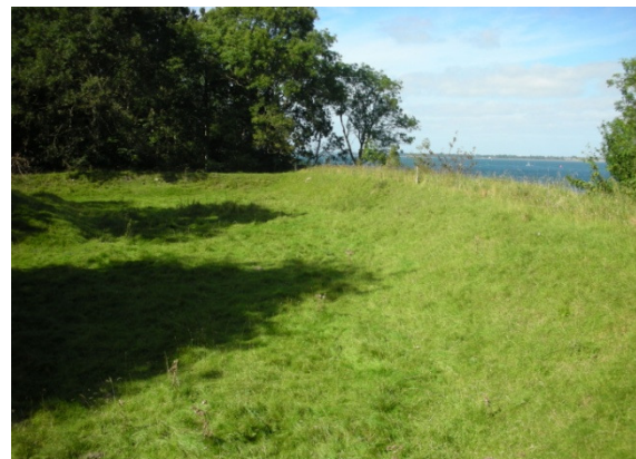
Skansen ud mod Østersøen