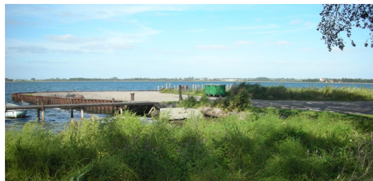
Færgen ved Grønsund med udsigt til Møn