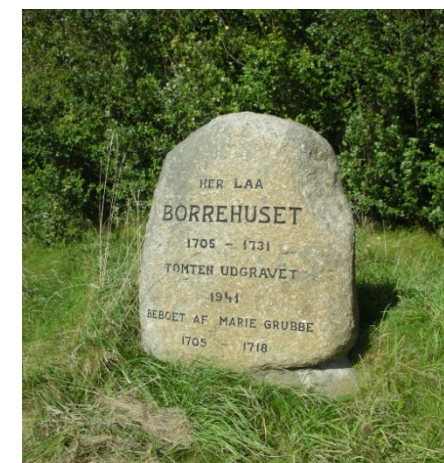
Her lå Borrehuset