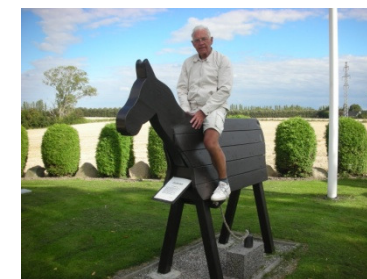
Ved Kippinge Kirke